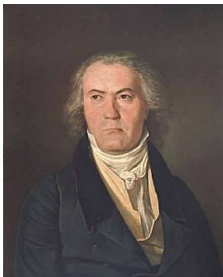
Beethoven en 1823, año en que terminó su Novena sinfonía. Retrato de Ferdinand Georg Waldmüller .

En 1816, realizó el primer esbozo de la Novena sinfonía y dos años más tarde su antiguo alumno y benefactor, el archiduque Rudolf, fue nombrado cardenal , motivo por el cual Beethoven comenzó a componer la Misa en re , aunque no estuvo terminada antes de la ceremonia de entronización. En 1822 , Beethoven tuvo un encuentro con Rossini en Viena, ciudad en la que este estaba cosechando grandes éxitos. Debido a las dificultades con el idioma y la sordera de Beethoven, el encuentro fue breve.