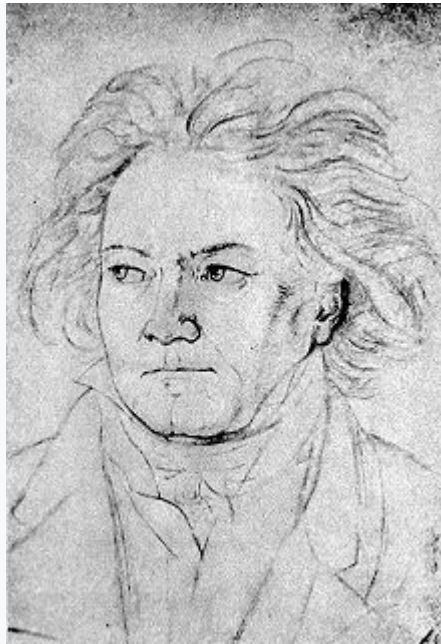
Retrato de Beethoven en 1818 realizado por August Klöber

Pero el ascenso de Gioachino Rossini y la ópera italiana , que Beethoven consideraba poco seria, lo colocó en segundo plano.