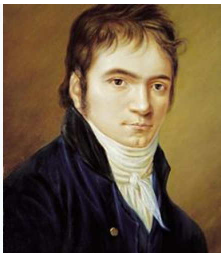
Beethoven en 1803 , pintado por Christian Horneman .

En 1800, Beethoven organizó un nuevo concierto en Viena en el que realizó la presentación de su Primera sinfonía . Su actividad musical iba en aumento y también impartió clases de piano entre las jóvenes aristócratas, con las que mantuvo romances esporádicos. Al año siguiente, Beethoven se confesó preocupado por su creciente sordera a su amigo Wegeler. En Heiligenstadt , el año siguiente escribió el conocido Testamento de Heiligenstadt , en el que expresa su desesperación y disgusto ante la injusticia de que un músico pudiera volverse sordo, algo que no podía concebir ni soportar. Incluso llegó a plantearse el suicidio , pero la música y su fuerte convicción de que podía hacer una gran aportación al género hicieron que siguiera adelante. En dicho testamento escribió que sabía que todavía tenía mucha música por descubrir, explorar y concretar.