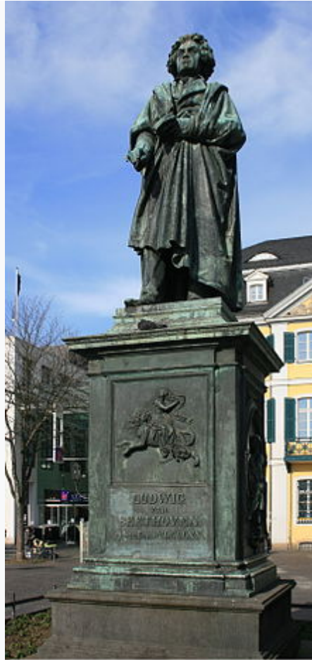
El monumento a Beethoven en Bonn , Münsterplatz.

Beethoven había entablado contacto con el inventor Johann Mäzel , que le construyó varios instrumentos para ayudarlo con sus dificultades auditivas, como cornetas acústicas o un sistema para escuchar el piano. El invento de Mäzel que más impresionó al compositor fue el metrónomo , y escribió cartas de recomendación a editores y comenzó a realizar anotaciones en las partituras con los tiempos del metrónomo para que sus obras se interpretaran al tempo que él había concebido. En esa época comenzaron los problemas económicos del compositor, ya que uno de sus mecenas, el príncipe Lobkowitz, sufrió una quiebra económica y el príncipe Kinsky falleció al caerse de su caballo, tras de lo cual sus herederos decidieron no pagar las obligaciones financieras que el príncipe había contraído con el músico.