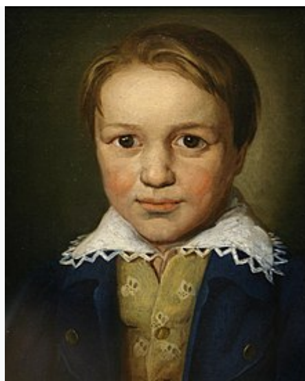
Retrato de Beethoven cuando tenía trece años.

El 17 de diciembre de 1770 fue bautizado su segundo hijo, en la iglesia de San Remigio de Bonn, con el nombre de « Ludovicus van Beethoven » ( Ludwig van Beethoven ) según se describe en el acta de bautismo .