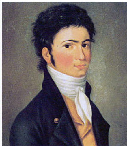
Retrato de un joven Ludwig van Beethoven, realizado por Carl Traugott Riedel

En 1782, cuando contaba con once años de edad, Beethoven publicó su primera composición, titulada Nueve variaciones sobre una marcha de Ernst Christoph Dressler (WoO 63).