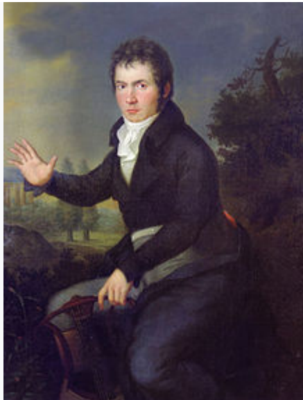
Retrato de Beethoven (hacia 1804 ), en la época de la Sonata Appassionata y de Fidelio .

Eran años en que las potencias monárquicas europeas se habían aliado para derrotar a la Francia revolucionaria . En una deslumbrante campaña en el norte de Italia , en la que el ejército austríaco fue derrotado, adquirió notoriedad Napoleón Bonaparte , que se convirtió en un ídolo entre los sectores progresistas . De esta época son la Sonata para piano n.º 8 , llamada Patética , y la Sonata para piano n.º 14 , llamada Claro de luna . Su Tercera sinfonía , llamada La Heroica (traducción de la denominación en italiano Eroica ), estaba escrita en un principio en «memoria de un gran hombre», Napoleón, que era visto en ese momento como un liberador de su pueblo. Cuando se declaró a sí mismo emperador , Beethoven se enfureció y borró violentamente el nombre de Napoleón de la primera página de la partitura. La Heroica se estrenó finalmente el 7 de abril de 1805 .