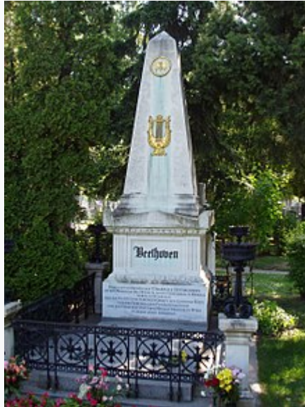
Tumba de Beethoven en el cementerio Zentralfriedhof de Viena

Al día siguiente, 24 de marzo de 1827 , Beethoven recibe la extremaunción y la comunión según el rito católico . Cabe señalar que las creencias personales de Beethoven fueron muy poco ortodoxas. Esa misma tarde entra en coma para no volver a despertar hasta dos días más tarde. Su hermano Nikolaus Johann, su cuñada y su admirador incondicional Anselm Hüttenbrenner le acompañaron al final, ya que sus pocos amigos habían salido a buscar una tumba.